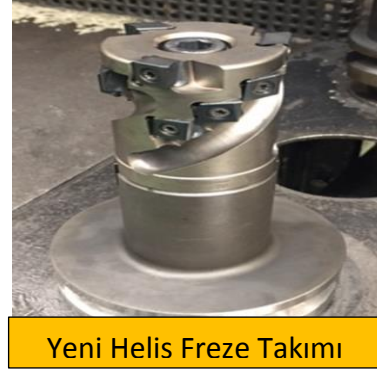
Yeni Helis Freze Takımı